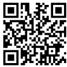
いっぽ ホームページ

中山地域ケアプラザ TEL:935-5694 地域の福祉施設。子育て支援事業として子育てサロンを開催