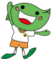
緑区キャラクター「ミドリ」