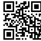
中山地域ケアプラザ LINE 公式アカウント