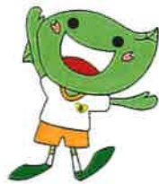
緑区キャラクター「ミドリ」