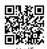
いっぽ ホームページ

中山地域ケアプラザ TEL:935-5694 地域の福祉施設。子育て支援事業として子育てサロンを開催