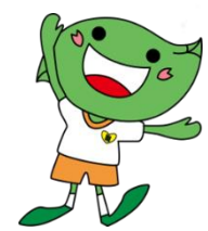
緑区キャラクター「ミドリ」