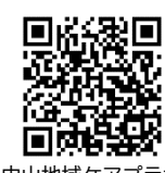
中山地域ケアプラザ ホームページ