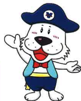
キャプテンわん ©ゆず華 (公財)横浜市スポーツ協会