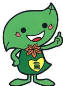
緑区キャラクター ミドリリン