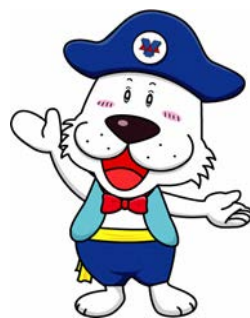
キャプテンわん ©ゆず華 (公財)横浜市スポーツ協会