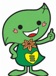
緑区キャラクター ミドリ