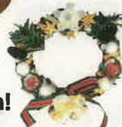
A finished product

Let's choice favorite item and make original wreath!