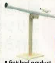
A finished product

The moon is full tonight! Let's make astronomical telescopes and observe a full moon!