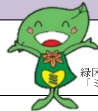
緑区キャラクター 「ミドリ」