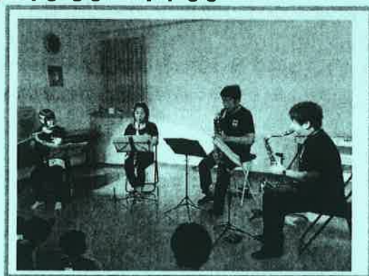
Ensemble Futaba(アンサンブル ふたば)