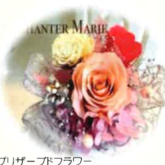
プリザーブドフラワー